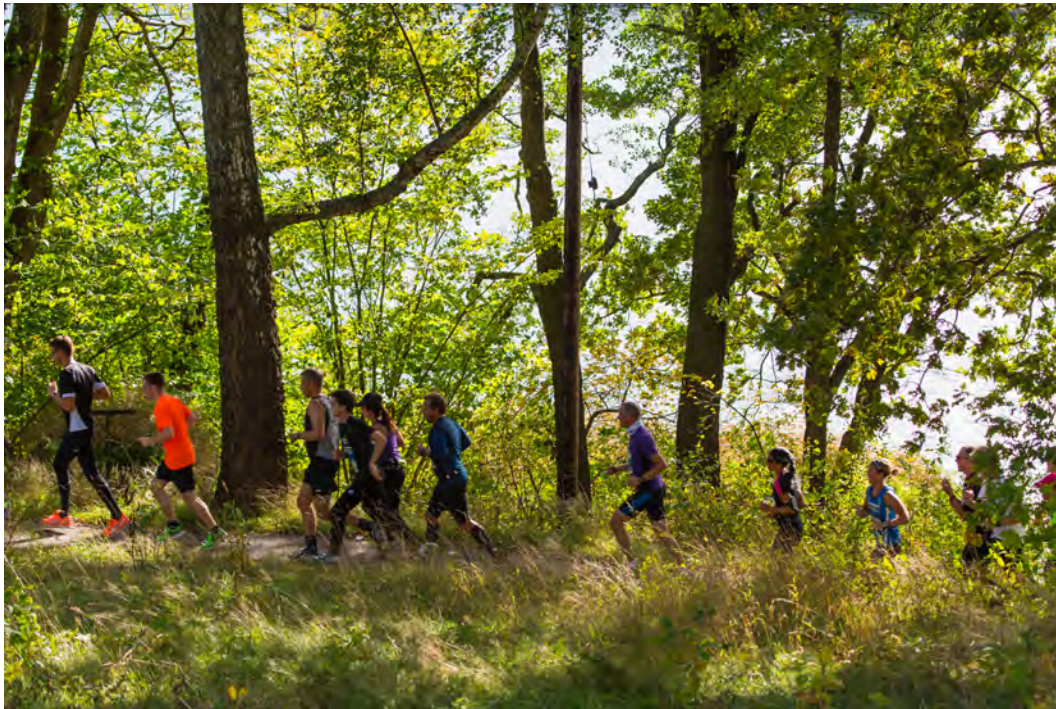
Lidingöloppet.