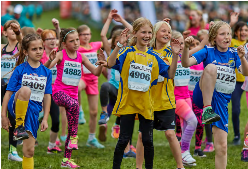
Lilla Varvet.