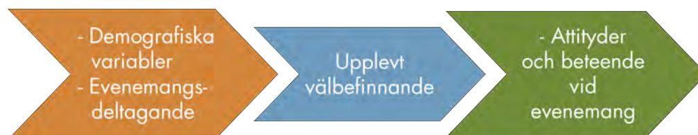
Figur 3: Antaganden för samband mellan evenemangsdeltagande och välbefinnande

Grundad på denna kunskap testade vi ett antal hypoteser för att förstå vad som påverkar en evenemangsdeltagares välbefinnande samt hur deras välbefinnande påverkar deras attityder och beteende vid evenemang: