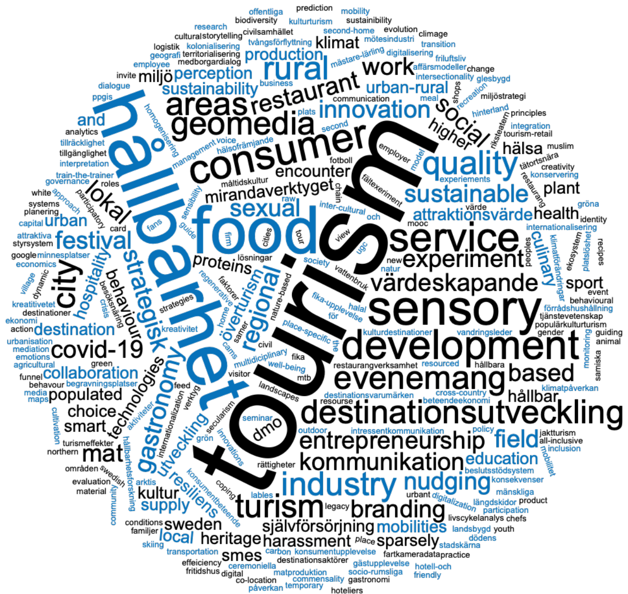
Figur 2. Ordmoln av keywords 2023.

Ordmoln skapat av inrapporterade nyckelord (keywords), max fem per pågående forskningsprojekt.